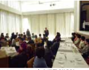
アゼリア会宝塚歌劇観劇