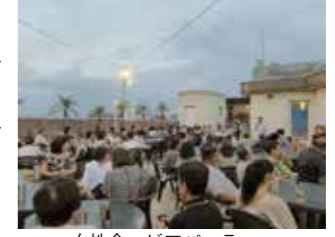
女性会 ビアパーティー