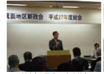
新政会 平成27年度総会