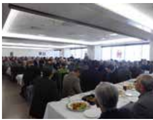
茨木後援会 国政報告会